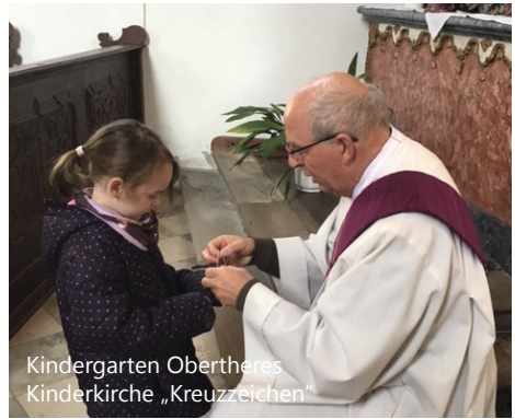
Kindergarten Obertheres Kinderkirche „Kreuzzeichen“