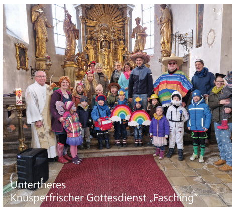
Untertheres Knusperfrischer Gottesdienst „Fasching“