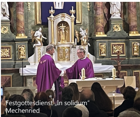
Festgottesdienst „In solidum“ Mechenried