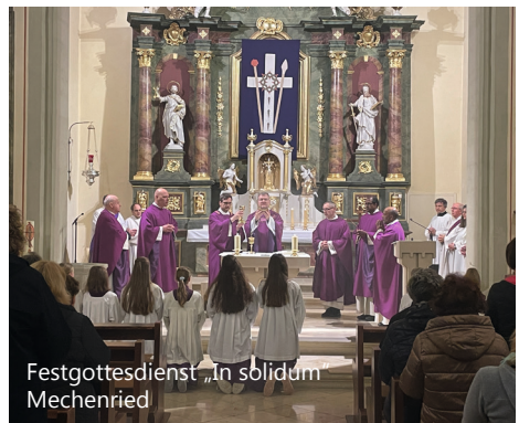
Festgottesdienst „In solidum“ Mechenried