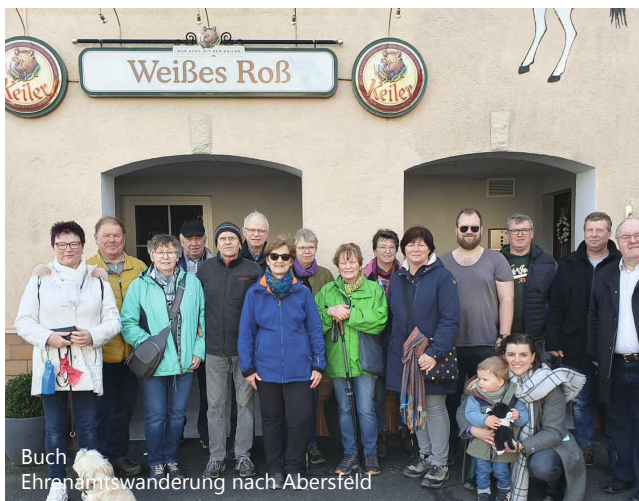
Buch Ehrenamtswanderung nach Aberfeld