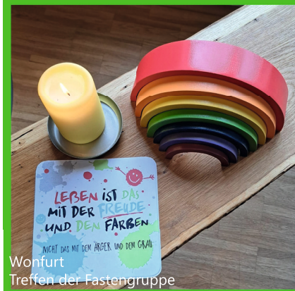
Wohnfurt Treffen der Fastengruppe