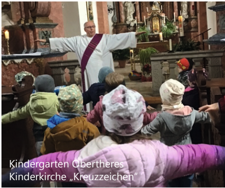
Kindergarten Obertheres Kinderkirche „Kreuzzeichen“