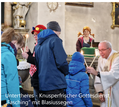
Untertheres - Knusperfrischer Gottesdienst „Fasching“ mit Blasiussegen

Anmeldung an: kirchenmusik@bistum-wuerzburg.de